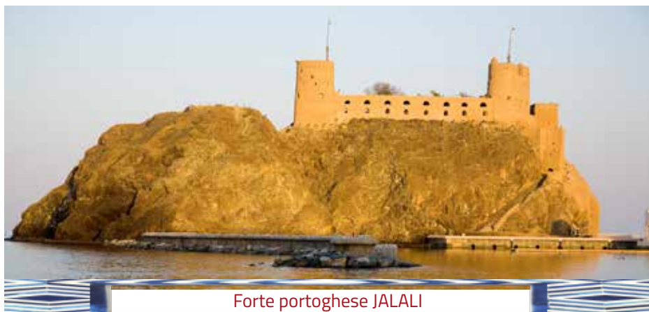
Forte portoghese JALALI

Arrivo a Muscat, dopo sbrigato le formalità doganali e ritirato i bagagli incontro con la vostra guida e visita della città iniziando dalla Grande Moschea di Muscat, splendido esempio di architettura araba moderna. Sosta fotografica all'Opera House e visita della Galleria dove si trovano lussuosi negozi. Arrivo in hotel per il pranzo e sistemazione nelle stanze. Pomeriggio visita dell'area di Muscat propriamente detta con il Museo Bait al Zubair che permetterà di comprendere costumi e tradizioni dell'Oman. Soste fotografiche all'Alam Palace, residenza ufficiale del Sultano e ai due forti portoghesi Jalali e Mirani posti a protezione dell'antico porto. Visita del suq di Muttrah e tempo a disposizione per shopping. Rientro in hotel, cena e pernottamento.