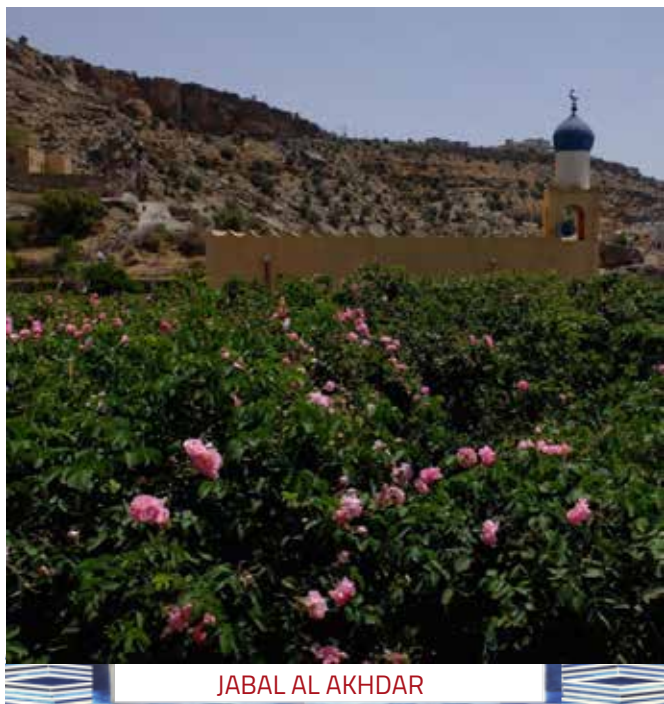
JABAL AL AKHDAR

6° giorno, venerdì 24 febbraio 2023 NIZWA - MISFAH - HAMRA BAHLA - JABREEN - MUSCAT