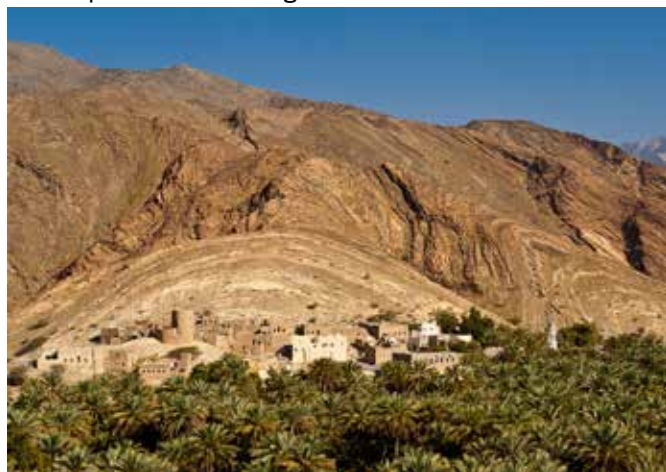
BIRKAT AL MAUZ

Visitate il villaggio Birkat Al Mauz, che significa piscina di banane. Attraversate il villaggio che si sviluppa tra fitte piantagioni di datteri e banane. Il sistema di irrigazione più antico, il Falaj, è ancora utilizzato in questo villaggio è classificato dall'UNESCO. Passeggiate tra i vicoli del villaggio con case di fango secolari che rivelano lo stile di vita passato della regione.